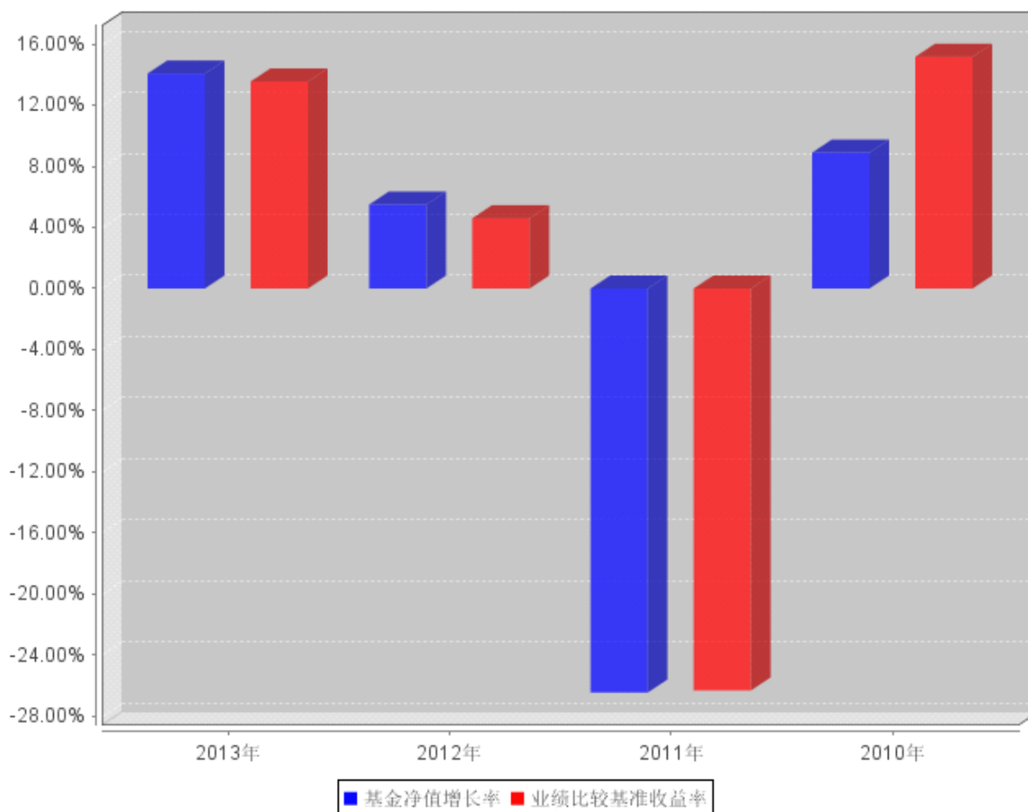
自基金合同生效以来基金每年净值增长率及其与同期业绩比较基准收益率的对比图