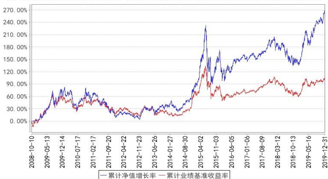
鹏华盛世创新混合累计净值增长率与同期业绩比较基准收益率的历史走势对比图

注：1、本基金基金合同于 2008 年 10 月 10 日生效。2、截至建仓期结束，本基金的各项投资比例已达到基金合同中规定的各项比例。